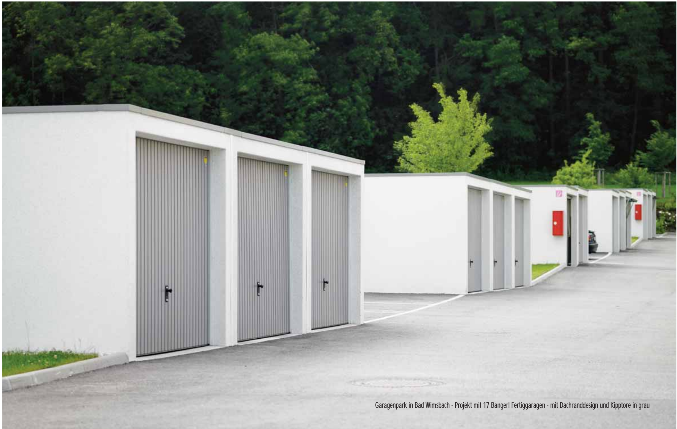
Garagenpark in Bad Wimsbach - Projekt mit 17 Bangerl Fertiggaragen - mit Dachranddesign und Kiptore in grau