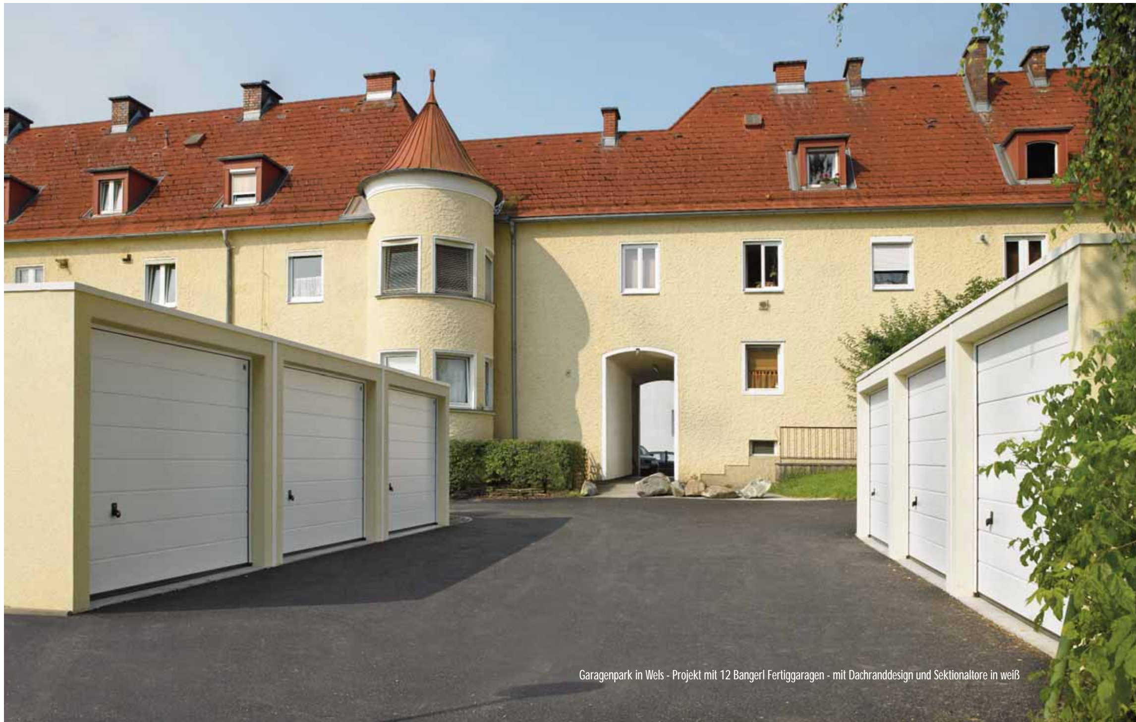
Garagenpark in Wels - Projekt mit 12 Bangerl Fertiggaragen - mit Dachranddesign und Sektionaltore in weiß