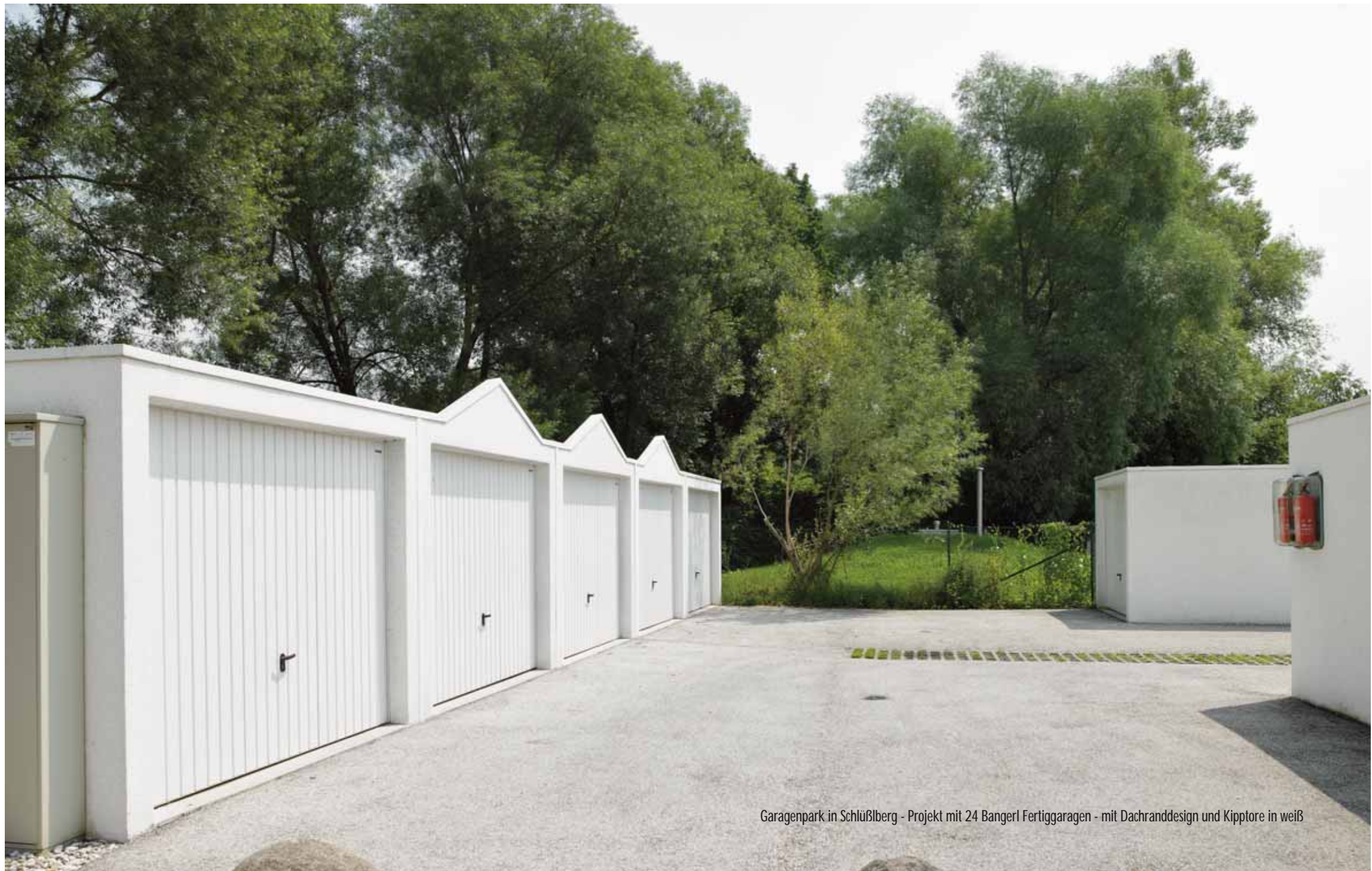
Garagenpark in Schlüßlberg - Projekt mit 24 Bangerl Fertiggaragen - mit Dachranddesign und Kipptore in weiß